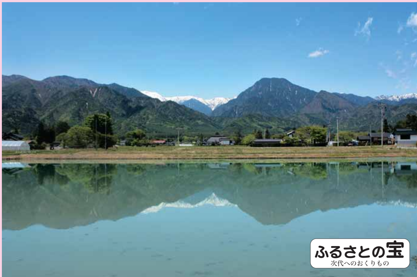
ふるさとの宝 次代へのおくりもの

ホームページ http://www.matsumotohojinkai.or.jp/ メールアドレス hojinkai@matsumotohojinkai.or.jp