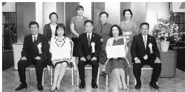
松本税務署長感謝状が贈られたみなさん