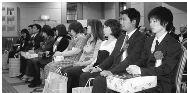
優良経理担当者表彰を受賞されたみなさん