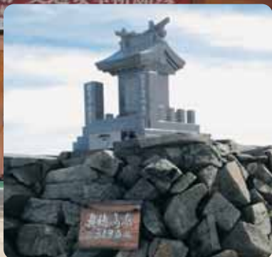
本年7月新たに建立された嶺宮