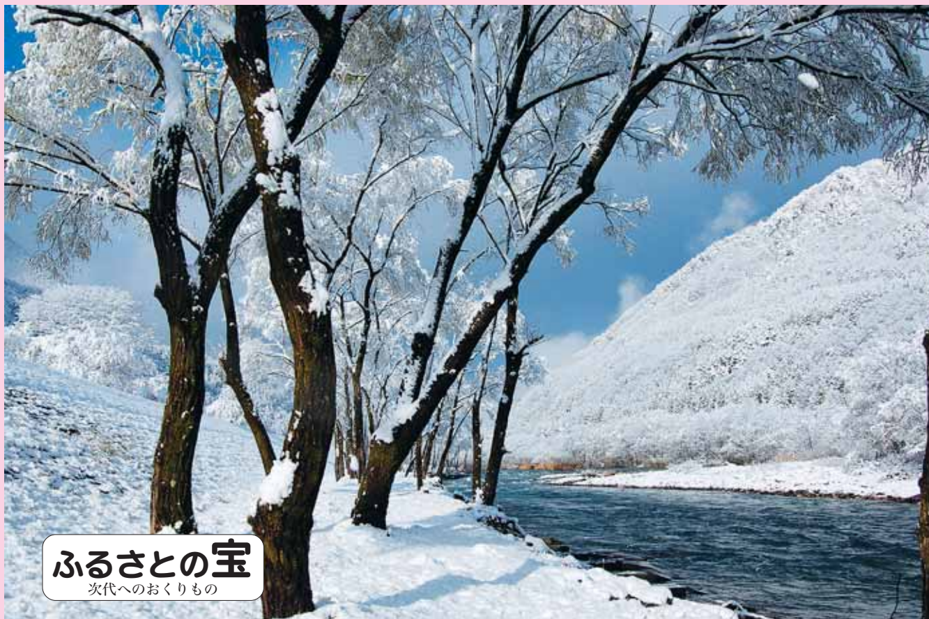
ふるさとの宝 次代へのおくりもの

ホームページ http://www.matsumotohojinkai.or.jp/ メールアドレス hojinkai@matsumotohojinkai.or.jp