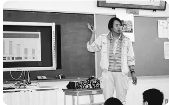
1月開催 松本市立波田小学校 講師・奥原租税教育活動委員

本年度は昨年12月に塩尻市立桔梗小学校、今年1月に波田小学校、2月に筑摩小学校において実施された、6年生対象の租税教室で青年部メンバーが講師役を担当しました。