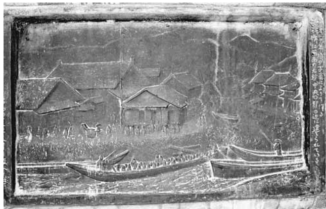
往時の水運の様子が描かれた記念碑

い物流網の誕生は、それまで物流面を支えていた陸運業に携わる人々から既得権益の侵害になるということで強い反対にあい、開業許可を得るために非常に長い期間を要したそうで、しかも積み荷などに関して宿場側と、違反すれば積み荷や船を焼かれてしまうというような厳しい取り決めをかわしていたそうです。