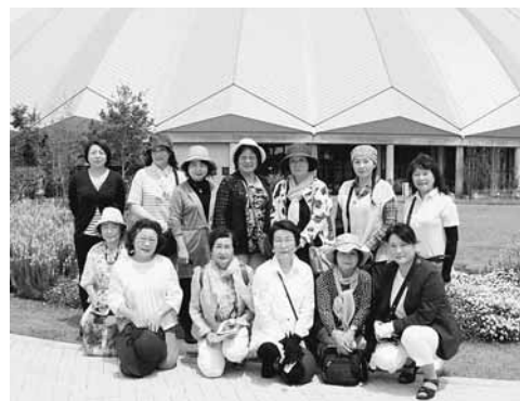
大勢のご参加ありがとうございました

メイン会場だけでも700品種100万株もの花々が咲き誇るイベントは期間中、想定来場者数50万人を大きく上回る70万人を超える大変大勢の方が訪れたそうです。お天気にも恵まれ、例会に参加された皆さんも美しい花々に癒されていたようでした。見学終了後には昼食会も開催し、部員同士の親睦を大いに深めることができました。