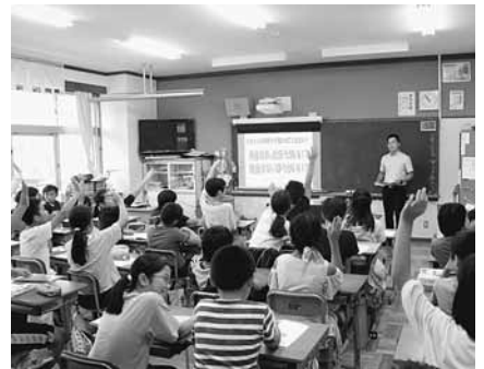
これからも租税教育活動に積極的に取り組んでいきます

さあ！ネットで申告・納税 イータックス (http://www.e-tax.nta.go.jp)