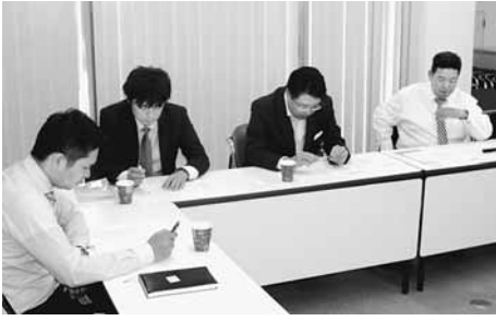
約2年前から青年部では打ち合わせを重ねてまいりました

んでいくこと の意思統一（部長宣言：「全員参加」管内全小学校での租税教室開催）講師依頼は全て引き受ける」）