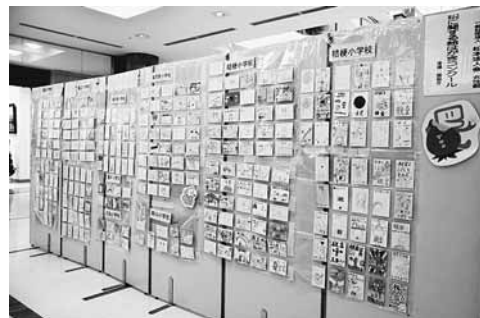
会場を彩った「税に関する絵はがき作品」

「税に関する絵はがきコンクール」は、小学生を対象に、税金の正しい知識と仕組みを伝えるために開催される「租税教室」に参加してもらった児童に、授業で学んだことを1枚の絵はがきに描いてもらう取り組みです。児童たちが税金について学び、感じたことが素直に描かれた作品はどれも素晴らしいものでした。