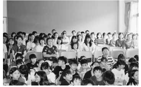
島内小学校では授業参観で租税教室の講師を担当

最も基本的な活動の一つである“小学校での租税教室開催”について、青年部が一丸となり取り組み、