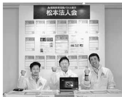
会場では活動内容をまとめたブースも出展しました

どこでも申告・納税 イータックス (http://www.e-tax.nta.go.jp/)