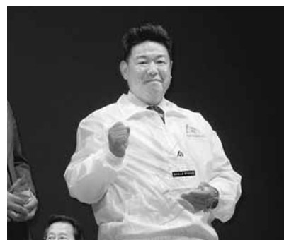
優秀賞を頂きました

今回、私たちは【租税教育活動の軌跡～管内全ての小学校での租税教室開催を目指して～】というテーマで発表を行いました。概要としましては、青年部長のリーダーシップのもと租税教育活動を青年部の柱と据え積極的に取り組