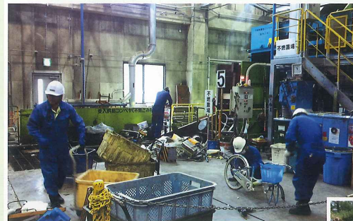
エコパーク寒川（飯山市）

ゴミの収集や自然環境の保護など、清潔で気持ちよく暮らせるための取り組みをしています。