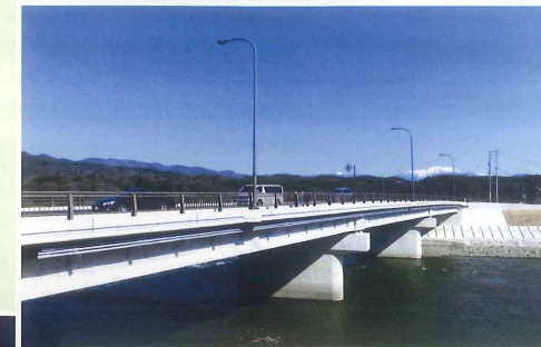
新天竜橋（南箕輪村）