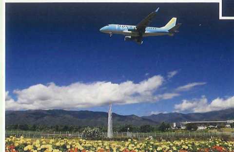
信州まつもと空港（松本市）