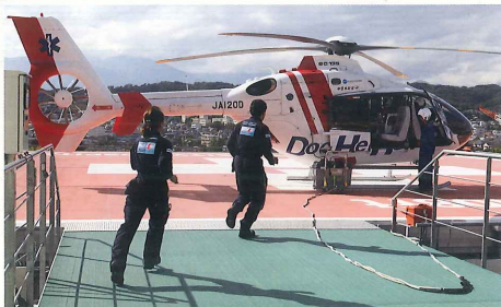
ドクターヘリ 信州大学医学部附属病院（松本市）