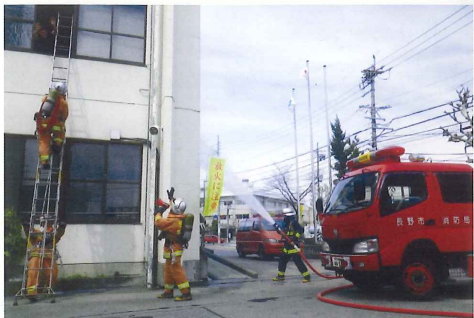
長野市消防局（長野市）