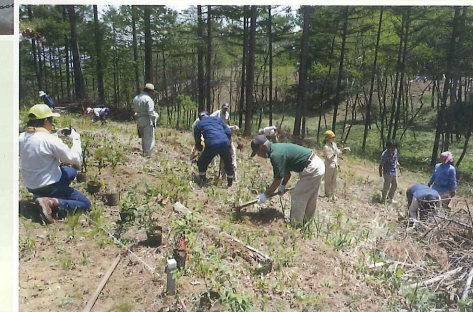
白田総合運動公園での植樹（佐久市）