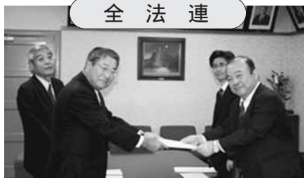
国税庁 長官 中原広氏(右手前)