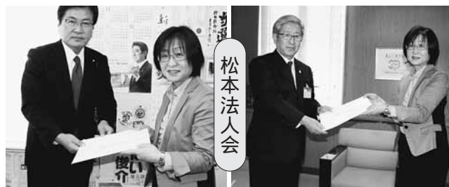
務台俊介衆議院議員(左) 松本市坪田副市长(左)と百瀬税制委員長

法人会では公平で健全な税制の実現を目指して会員企業の意見や要望を反映しながら、税のあるべき姿や将来像を見据えて建設的な提言活動を展開しています。