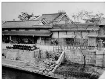
大同生命の礎を築いた 大坂の豪商“加島屋”