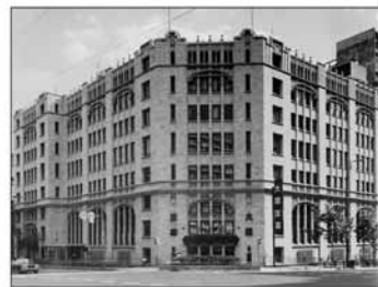
旧肥後橋本社ビル (設計:W・M・ヴォーリズ)