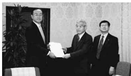
財務省 財務副大臣 岡田直樹氏(左)

また、全法連でも平成27年10月から、関係省庁、政党への税制改正に関する提言活動を実施しました。