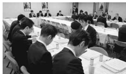
自民党 予算・税制に関する政策懇談会