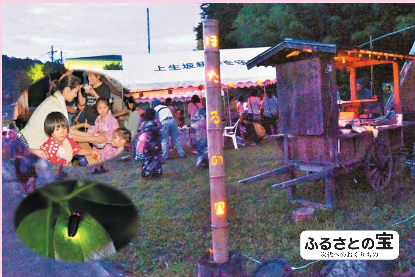
ふるさとの宝 次代へのおくりもの

ホームページ http://www.matsumotohojinkai.or.jp/ メールアドレス hojinkai@matsumotohojinkai.or.jp