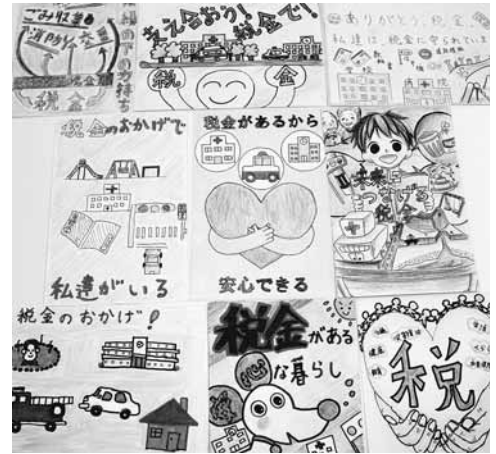
どの作品も素晴らしいものでした

作品選考会を開催し、女性部正副部長の皆さんと寄せられた作品1点1点を確認し、最優秀賞となる松本税務署長賞1点、優秀賞7点、特別賞1点を選考いたしました。