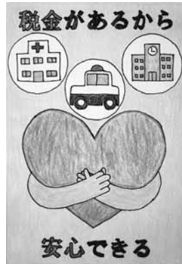
松本税務署長賞（最優秀賞）に輝いた作品

女性部では松本税務署ならびに管内小学校にご協力をいただきながら租税教育活動の一環として【税に関する絵はがきコンクール】を実施しております。本年度も小学校で租税教室を受講した児童たちに、授業で学んでもらった『税』についての知識を一枚の絵はがきに仕上げてもらい取り組みを実施し、安曇野市立穂高南小学校、松本市立今井小学校の6年生、合計128名にご参加いただきました。