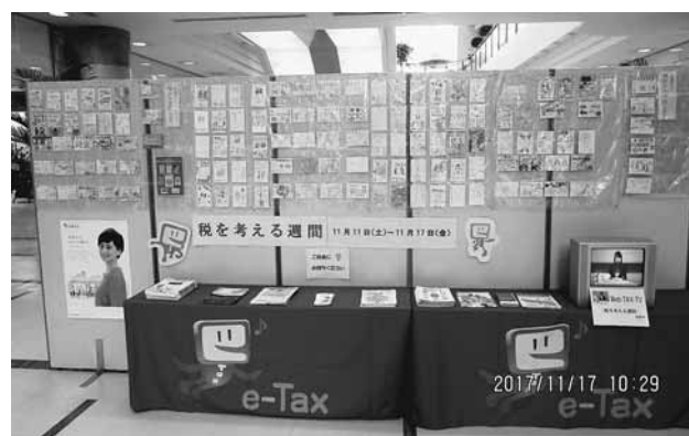
会場に飾られた絵はがき

○女性部主催「税に関する絵はがきコンクール」応募作品がアイシティで開催された『税金展』で展示されました♪