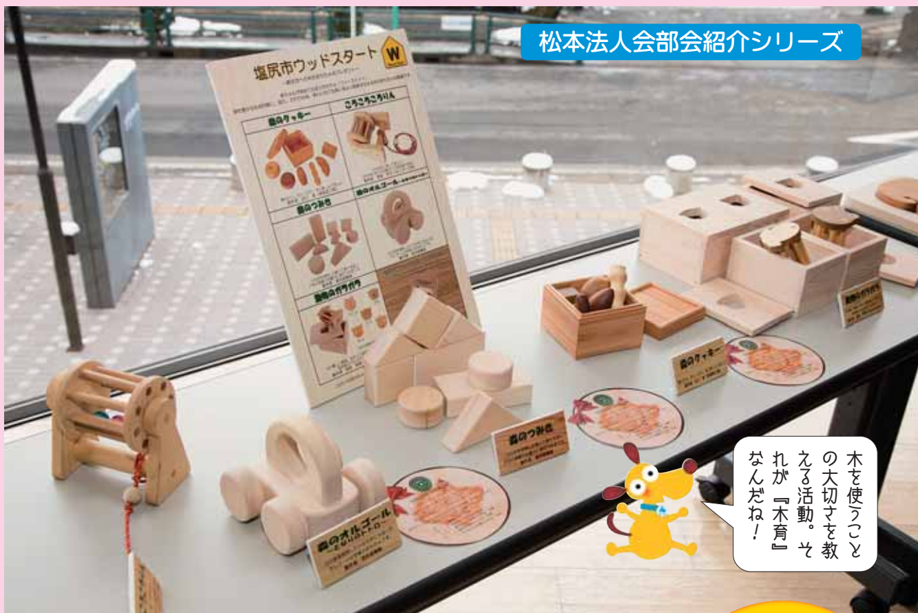
松本法人会部会紹介シリーズ

ホームページ http://www.matsumotohojinkai.or.jp/ メールアドレス hojinkai@matsumotohojinkai.or.jp