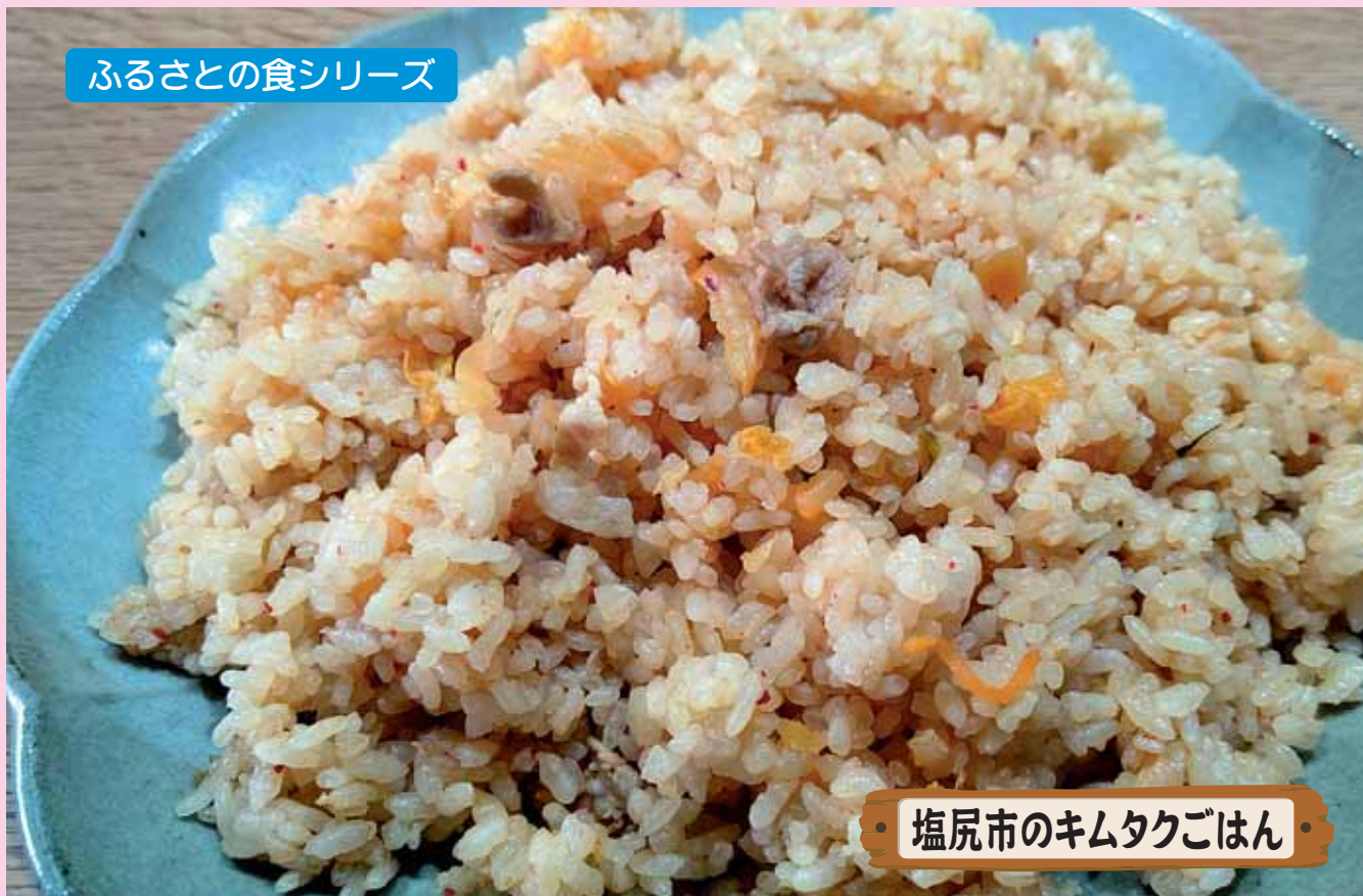
塩尻市のキムタクごはん