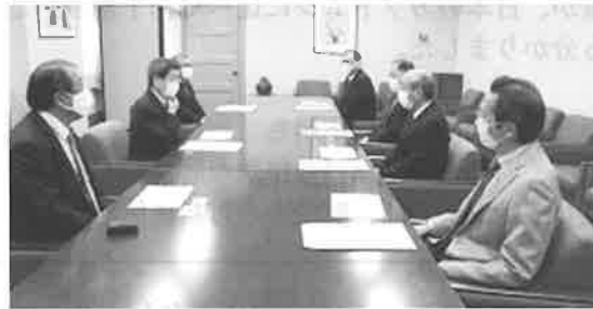
(表敬訪問) 国税庁 可部長官 (右手前から2番目)