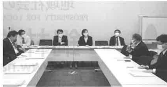
立憲民主党 税制改正要望ヒアリング