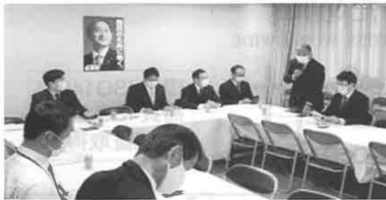
自由民主党 予算・税制等に関する政策懇談会