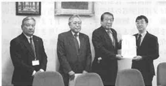
中小企業庁 飯田事業環境部長 (右)