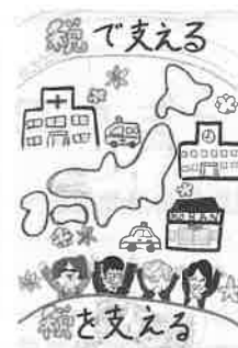
松本法人会女性部長賞受賞作品

女性部長賞1点、優秀賞12点、特別賞14点を選考し、受賞者には後日表彰状等をお届けしました。