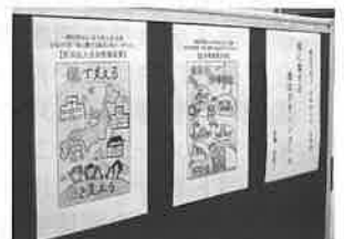
確定申告期間中、松本税務署に作品が展示されています

どの作品も、税について児童たちが学び、感じたことを素直に表現してくれている素晴らしい作品でした。受賞作品は大勢の一般の方々が税務署を訪れる確定申告期間中、松本税務署に展示しておりますので、会場を訪れた際にはご覧いただければ幸いです。