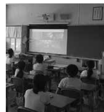
オンライン授業の様子