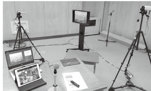
小学校の機材をお借りして リモート授業も実施