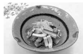
代表的な調理例 酢の物

皆様ご存知かと思いますが、そのままでは塩辛くて食べられませんので水に浸して「塩抜き」が必要となります。どんな味を求めると塩抜きの時間は変わるようですが、塩辛すぎても、味が抜けすぎてもいけませんので注意が必要です。塩抜き後は手軽に調理いただけます。キュウリやわかめを加え、酢で和えた酢の物がポピュラーですが、粕和えや天ぷら、いかめしなどにアレンジされる方もおられるようです。