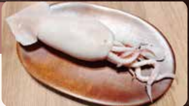
調理前の “塩丸いか”