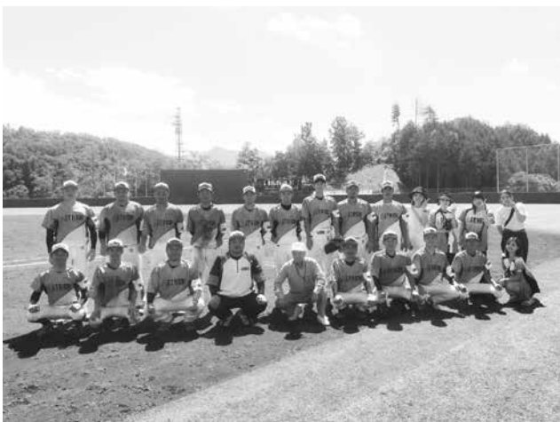
赤羽アイシンククラブのみなさん